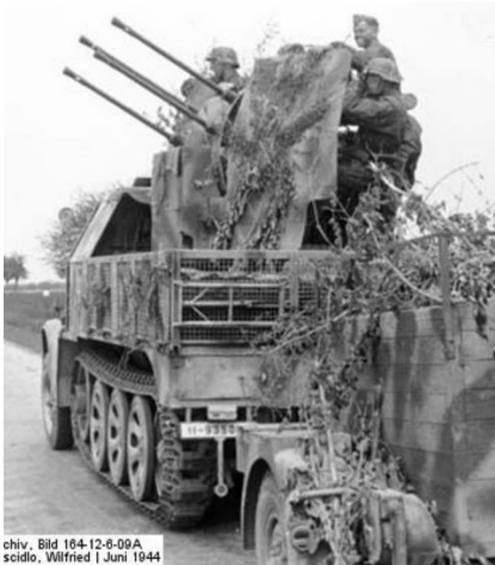
Juni 1944 Duits 20mm "Flakvierling" geschut